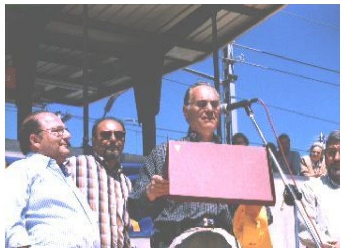
El Jesús amb la placa